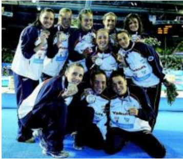
El equipo español –las ocho titulares y dos reservas– posan con la plata por equipos libre